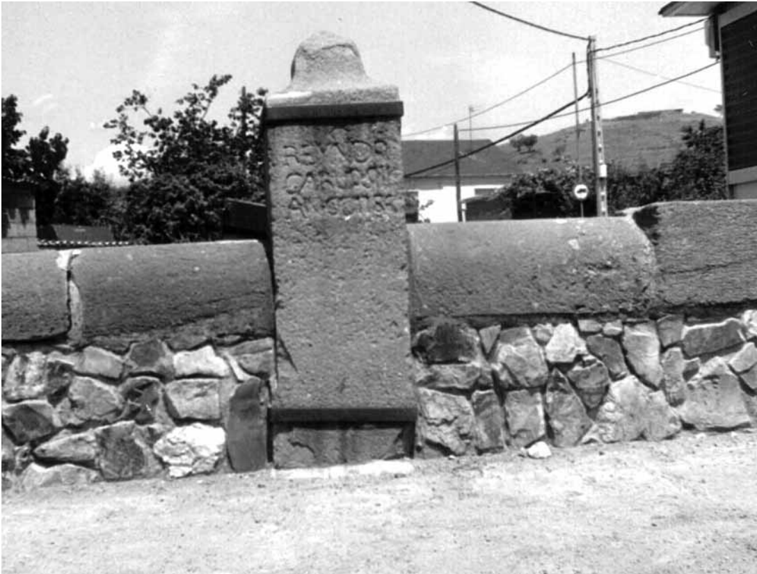
Fig. 8. Alcantarilla de Mojasacos (Bembibre)