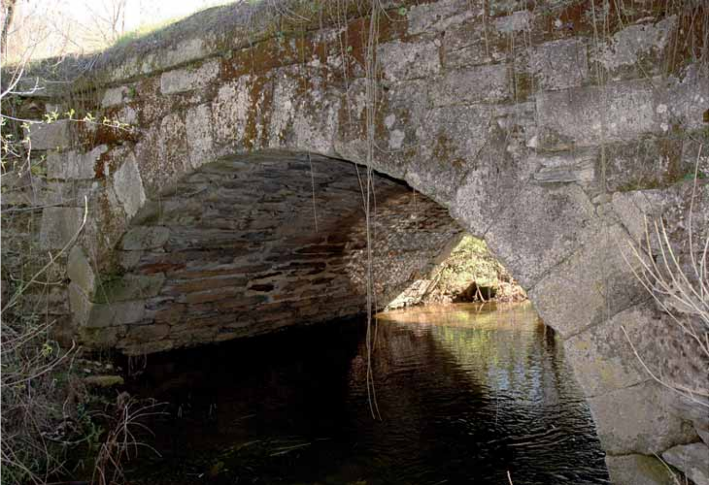
Fig. 15. Puente de Cobrana.

alegan “que ellos tienen asignado para el reparo de su puente los derechos de castillaje y portazgo”; se excusan igualmente los de Cacabelos manifestando que “ellos tienen tres puentes que reparar para el paso de peregrinos y que