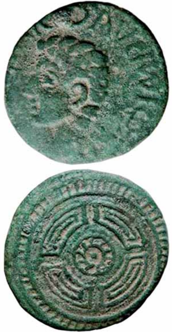
Fig. 3. Moneda de la Caetra, encontrada en San Román de Bembibre, acuñada con motivo de las guerras cántabras.

Sabemos que las comunicaciones alto-medievales se organizaron a partir de las calzadas de época romana, evitando desniveles acentuados, conectando Castilla con Galicia a su paso por El Bierzo 11 , con una configuración geográfica de difícil entrada, rodeada de montañas, que la mantuvo relativamente aislada y mal relacionada, siendo conocida también como la Suiza Leonesa 12 . Igualmente la proximidad a Ponferrada, como centro tradicional de la rica comarca y su