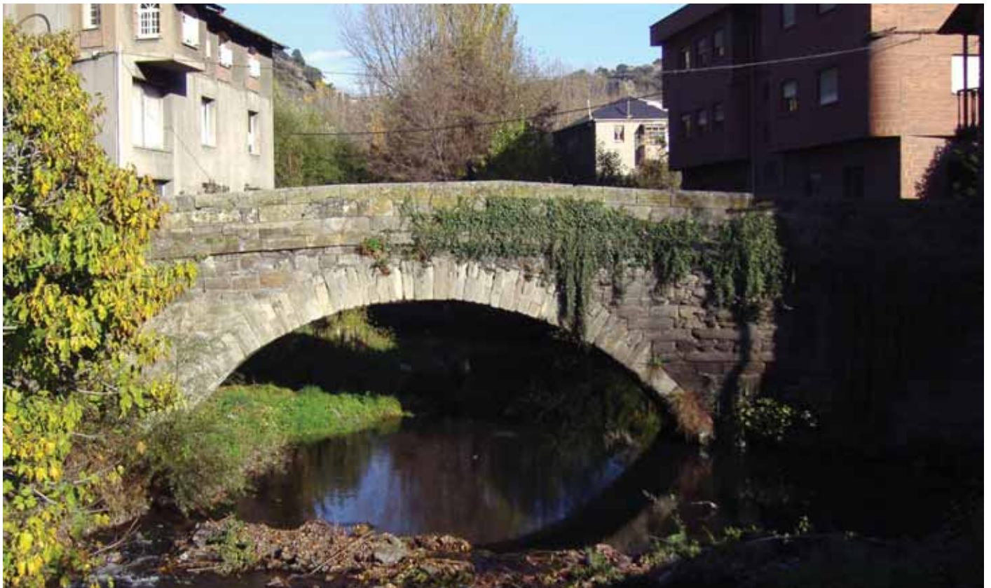
Fig.11. Puente de Torre del Bierzo.

En la vertiente del Boeza destaca “ el puente de Lagares ” o de Las Ventas de Albares, que dista de Bembibre “ un cuarto de legua ” 62 . Hecho en la segunda mitad del siglo I d. C. 63 , y renovado a su vez en el año 1536 64 , se describe