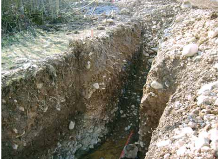
Fig. 7. Corte del “Camino de la calzada” de San Román de Bembibre

En la excursión que Jovellanos realiza por El Bierzo en 1792, elogia la técnica constructiva de los trabajos de ingeniería desarrollados sobre esta ruta: