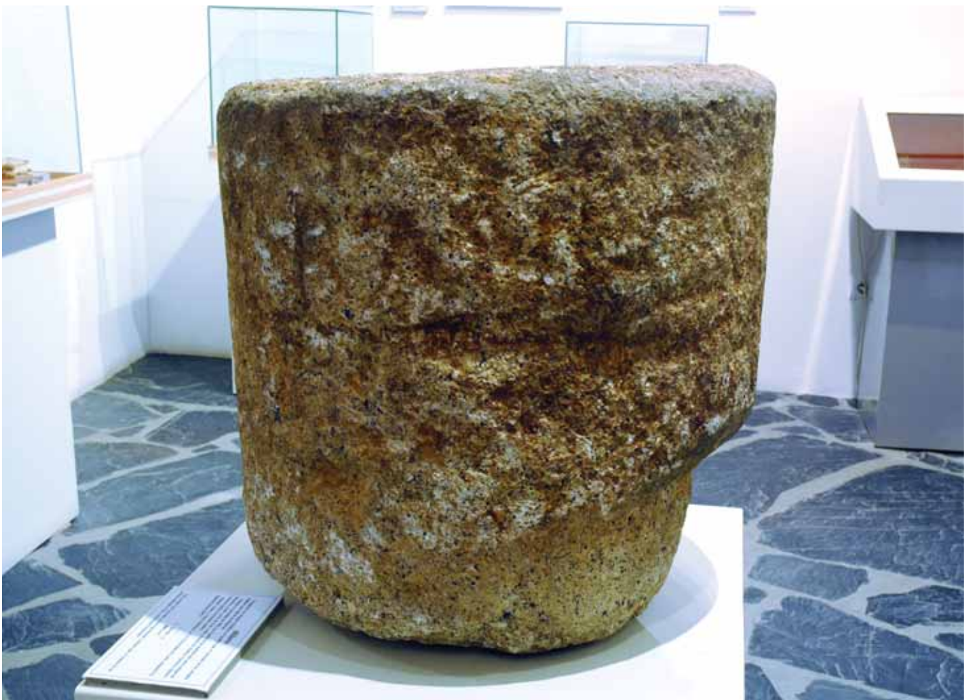
Fig. 4. Miliario romano de Bembibre