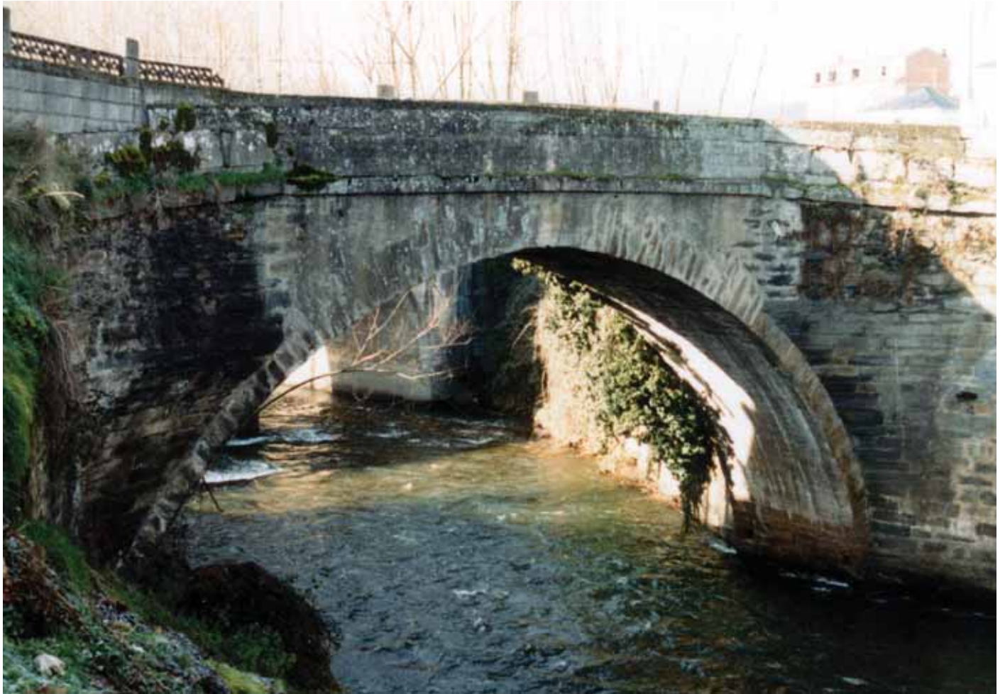
Fig. 12. Puente de Lagares o de Las Ventas de Albares.

El puente de San Román de Bemibre se alza sobre el “rio que se llama de Viñales (...) en el camino frances e pasaje de romeria del señor Santiago” 76 . De posible origen romano, su traza estaba constituida por “un arco de pyedra de grano e cal” 77 . Desapareció en la decimoquinta centuria “al chocar contra el una nogal que bajo por el rio con una fuerte riada y derribo la dha puente”. De aquella vieja fábrica latina quedaba “un çimiento antiguo de cal e canto de obra de quince pies en ancho, que demuestra aver sydo edificio de una calçada de pyedra e cal, o estribo de