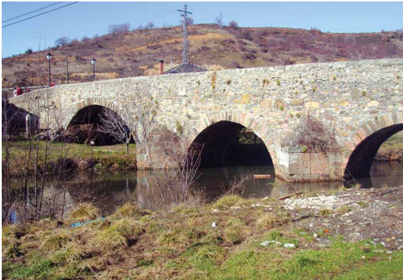
Fig. 13. Puente de San Román de Bembibre.

una carga constante para el erario concejil pues en corto espacio de tiempo las aguas ya se lo habían llevado tres veces 80 . Por cuya razón, se plantearon la posibilidad de volver ha hacerlo de madera, o bien de dos pilares de piedra y tablonos “como esta el de la villa de Bembibre”, y cuyo coste rondaría los 10.000 mrs. o 12.000 mrs. Finalmente optarían por un “puente de dos arcos de canto labrado y cal”, presupuestado en 110.000 mrs., cantidad que se podría repartir entre los “ocho o nueve mil vecinos de los logares que deven contribuir” 81 .