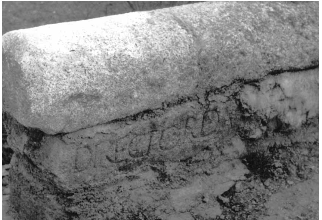
Fig. 14. Inscripción del puente de San Román de Bembibre.

dicho ojo y da muestras de hallarse hendido”, de ahí que haya de ser reparado 83 . En 1761 vuelve a presentar amenaza de ruina e “ indicios de desvanecerse su edificio ”. Las obras de nueva fábrica fueron encomendadas en 1763 al cántabro, Antonio de la Carrera 84 y reconocidas poco tiempo después por Carlos Lemaury 85 .